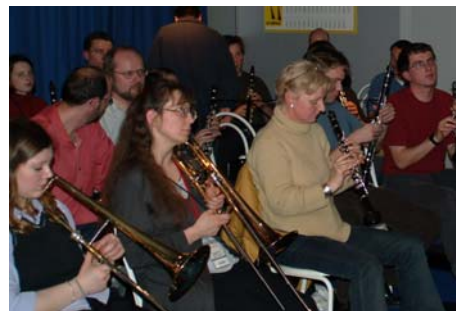
Deelnemers aan de BläserKlassen-Workshop

Bij „Robbie“ werd iedereen in de gelegenheid gesteld kennis te maken met de eerste muzikale ervaringen van een klein kind; in de proefles „BläserKlasse“ konde de deelnemers –misschien voor de eerste keer - een orkestblaasinstrument van hun keuze uitproberen.