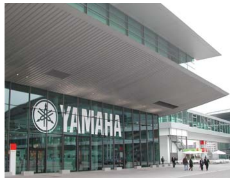
In het Forum presenteerde YAMAHA op drie verdiepingen producten en knowhow en nodigde mensen uit tot uitproberen van de instrumenten.

Onder dit motto werden door de „stichting 100 jaar Yamaha“. in samenwerking met de Musikmesse en de YAMAHA Academy Of Music, Hamburg, muziekpedagogen uit prive en gemeentelijke instituten uitgenodigd omde werkwijze en achtergronden van de YAMAHA muziekscholen en het school-muziekprogramma van YAMAHA te leren kennen .