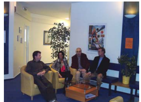
De wachtruimte in de Yamaha Academy of Music in Hamburg