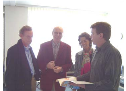
Bekijken van materiaal, observeren van lessen...

In de toekomst zullen er bij voldoende belangstelling wellicht nog meer van dergelijke reizen worden georganiseerd.